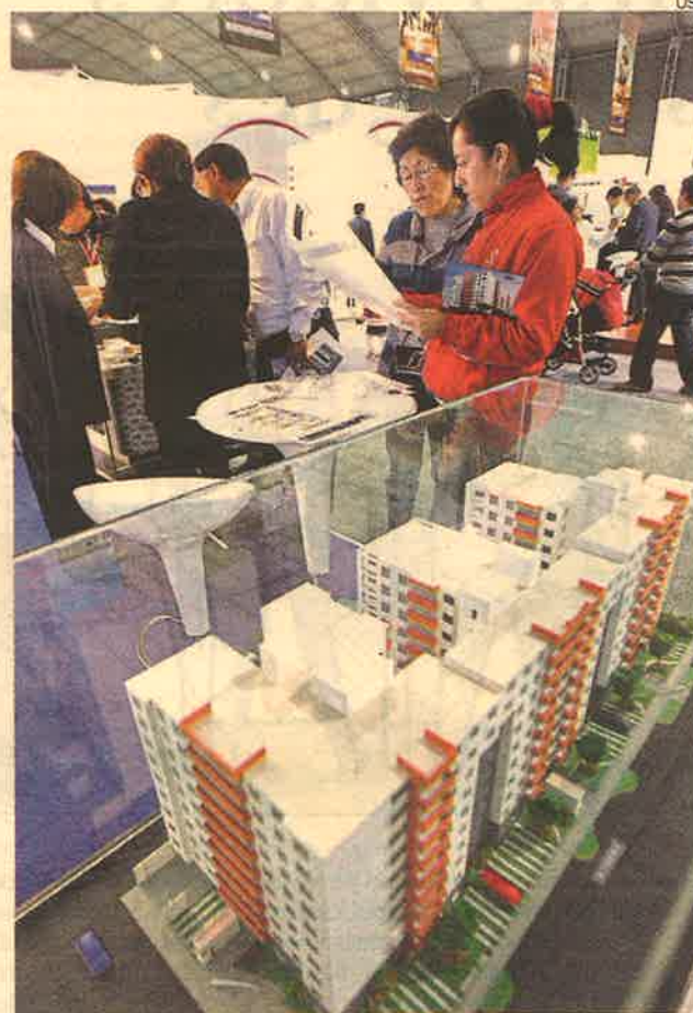
Motores. Uso de fondos de AFP y ampliación de precios de inmuebles bajo el programa Mivivienda impulsarán la demanda de departamentos.

“Hay mucha gente que hoy no puede comprar una vi-