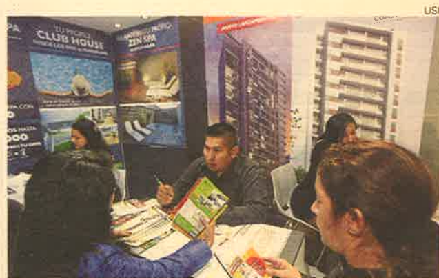
Sistema financiero. Perspectivas son favorables para todo el 2017.

—En el tercer trimestre ya hay signos de recuperación del financiamiento bancario. Préstamos crecerían 13.5%, y mora bajaría a 2.5% el próximo año.