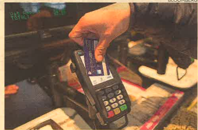
Pagos. Serán masivos en el 2017 con la nueva tecnología.